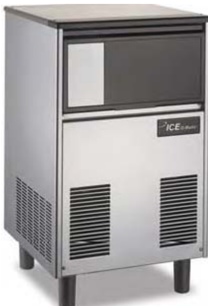
Producción 66 kg Refrig...aire o agua