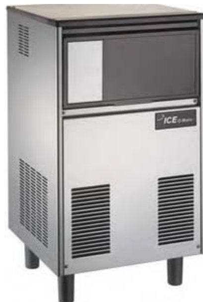
Producción 35 kg Refrig...aire o agua