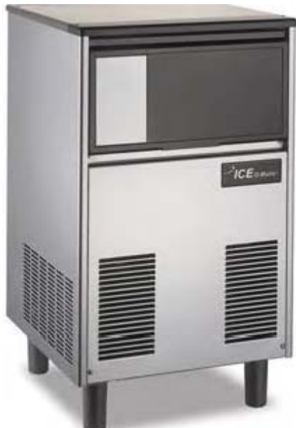
Producción 47 kg Refrig...aire o agua