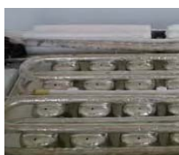
Detalles inyectores, sistema mecánico y sonda en evaporador.