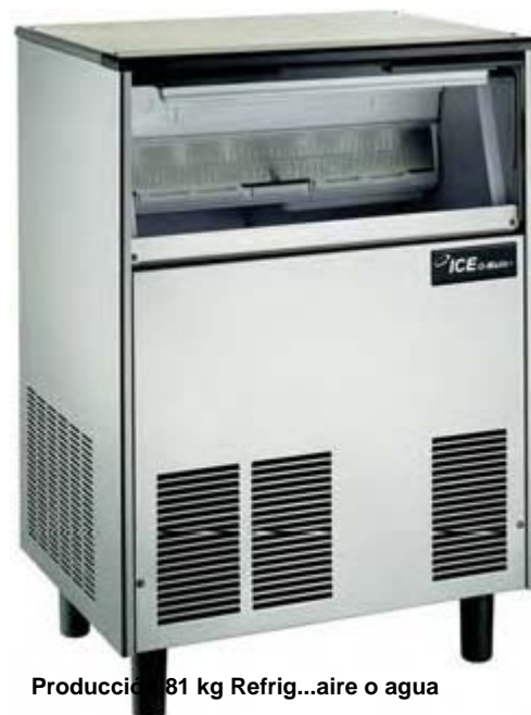
Producción 81 kg Refrig...aire o agua