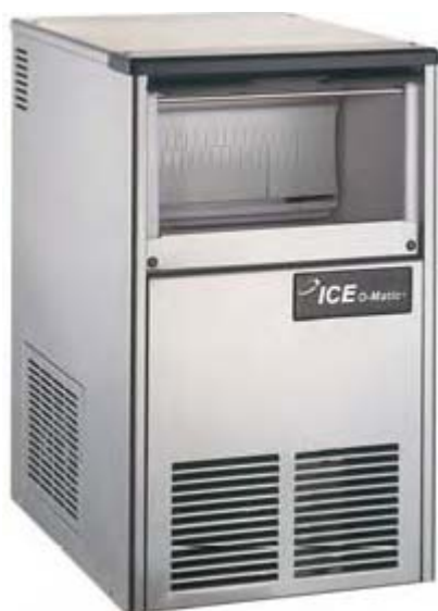
Producción 23 kg Refrig...aire o agua