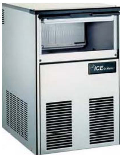
Producción 26 kg Refrig...aire o agua